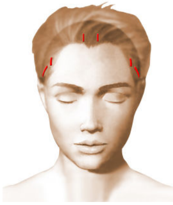
incisions = cicatrices

Chaque chirurgien adopte une technique qui lui est propre et qu'il adapte à chaque cas pour obtenir les meilleurs résultats. Toutefois, on peut retenir des principes de base communs :